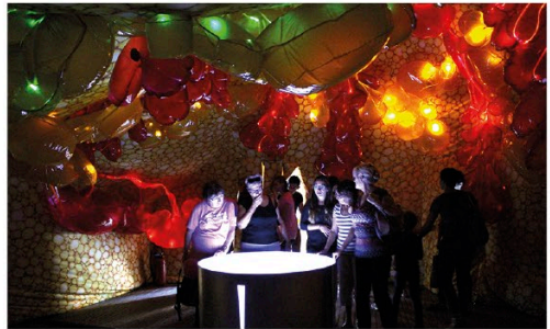
La structure « Voyage au cœur du sein », réalisée par Emilie Prouchet-Dalla Costa, est un buste géant (de 300 m 3 ), spectaculaire qui s'apparente à un véritable événement dans les lieux où elle est mise en place.

«Voyage au cœur du sein» Venez la découvrir !