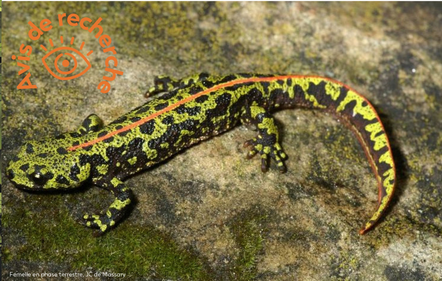
Femelle en phase terrestre, JC de Massary