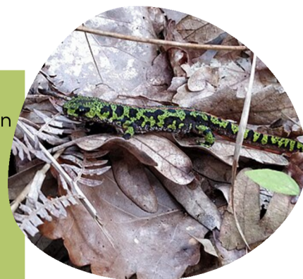
Femelle sur un tas de feuilles

Le Triton marbré effectue des mouvements saisonniers (quelques dizaines à centaines de mètres) avant et après la phase de reproduction. Il a ainsi besoin de milieux humides et aquatiques en bon état, ainsi qu'un réseau de haies bocagères de qualité (vieux arbres, d'essences locales, différentes strates de végétation etc.). Au jardin, on peut l'aider en conservant des tas de bois, de feuilles mortes, des arbres et des talus, autant d'abris qu'il apprécie pour son repos hivernal !