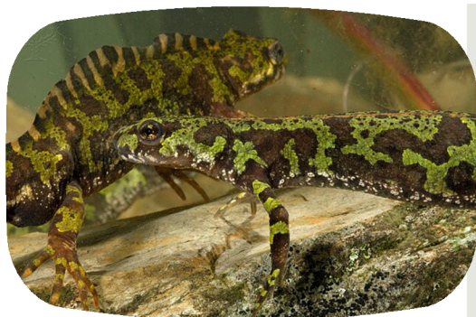
Mâle et femelle en phase aquatique, Reni Akande

La phase aquatique correspond à la période de reproduction, qui peut débuter dès février. Les adultes, opportunistes, se rendent dans des mares, fossés, lavoirs ou ruisseaux à cours lents. Les mâles paradent devant les femelles en faisant vibrer leur queue, envoyant des phéromones. Ils déposent ensuite au fond de l'eau un spermatophore, sorte de poche de spermatozoïdes, qui sera récupéré par femelle. Celle-ci pondra jusqu'à 400 œufs , déposés un à un dans la végétation aquatique. La métamorphose des larves se déroule en été, et sera assez rapide si les températures sont élevées.