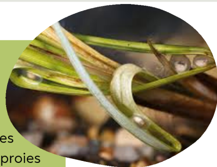
Œufs disposés dans la végétation, La Salamandre

A l'état larvaire, le Triton marbré se nourrit de petits invertébrés aquatiques (plancton, copépodes, larves d'insectes...), et les adultes se nourrissent de proies variées (mollusques, vers, larves diverses)..