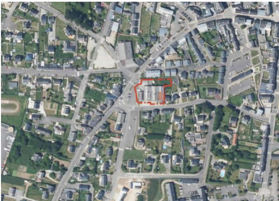
Plan de masse du projet