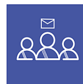
Convocation des élus