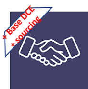
Salle des marchés publics