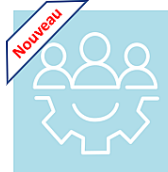
Partage et collaboration Avec 50 comptes et 50 Go