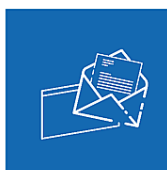
Télétransmission actes et flux comptables