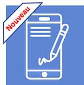
Signature en ligne Avec seuil d'usages